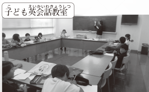
子ども英会話教室