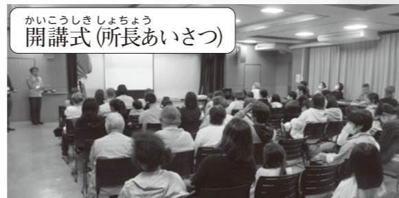
開講式(所長あいさつ)