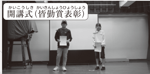
開講式(皆勤賞表彰)

今年度は、子ども向け6講座、大人向け3講座の計9講座を開講しており、たくさんの方にお申込みいただきました。この場を借りてお礼申し上げます。センター職員一同、受講生の皆さんが講座を通して交流を深め、学習が実りあるものとなるよう、努めてまいります。