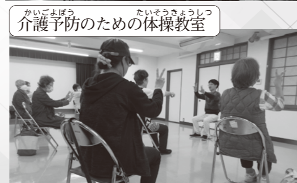
介護予防のための体操教室