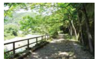
△新緑に囲まれた廃線敷