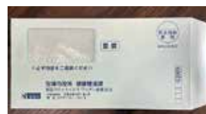
予診票は予約後に青い封筒が届きます

ワクチンは順次供給され、6月以降には市内101か所の医療機関での接種(個別接種)も開始予定です。 個別接種予約方法については、追ってお知らせします。