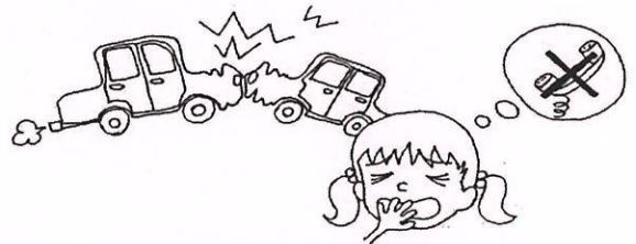
交通事故や緊急時