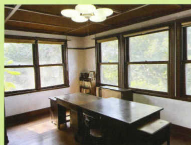
2階 書 齋