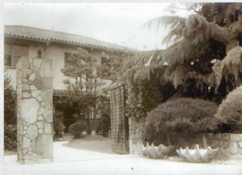
昭和30年代の旧松本邸

改修されやすい台所や浴室、便所を含め内外ともに建設当時の状態を良好に留め、防空壕やワイナリーなどの付属建物も残存していることでも注目されます。