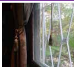
タイムスリップ(旧松本邸) apohawaii

#たからづかな生活 ※投稿作品は本人が撮影し、被写体(人物など)に掲載の許可が得られたものに限りです。