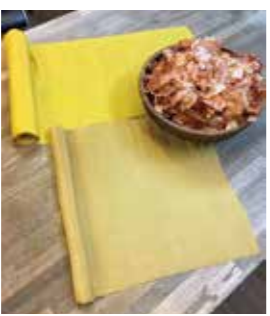
タマネギの皮で染めた染物