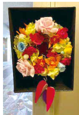
春にぴったりのお花のリース