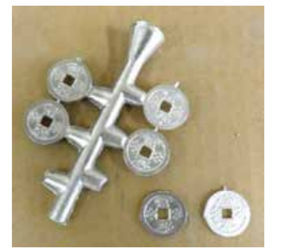
富本銭枝付き(左)、銭のみ(右)