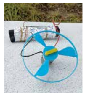
備長炭電池とプロペラ

文化芸術センター(☎62・6800 FAX62・6880、event@takarazuka-arts-center.jp、水曜休館)