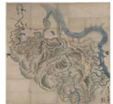
公開中の絵画の一例 「武庫川筋土砂留普請所絵図」