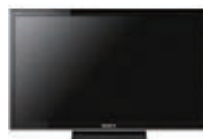
省エネ型液晶テレビ SONY ブラビア (24 型)