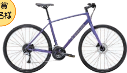
クロスバイク TREK FX3 disc (9 万円相当) ※サイズ、カラー選択可