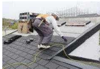
屋根の断熱化工事

・外断熱改修を行う場合、屋根自体の厚さが増加することにより、高さ制限に抵触する可能性がある。