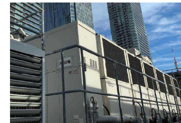
屋上の省エネ設備

・新たに屋上に省エネ設備や再生可能エネルギーを設ける場合に、高さの制限に抵触する場合がある。