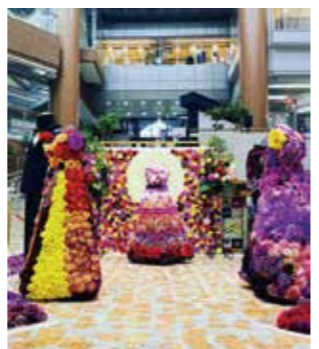
昨年10月実施「ダリアアート」(今回の展示内容とは異なります)

「夏」をテーマに約5千輪のダリアが、華やかで涼しげな雰囲気を演出します。 期 間 7月16日(土)・17日(日)