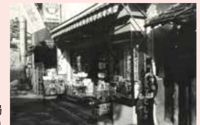
文化芸術センター(☎62・6800 FAX62・6880)

来年開催予定の企画展「宝塚に映画館があった頃。」に展示する、昔の宝塚の写真を募集します。昭和20年~45年頃の市内の映画館や商店街などまちの様子が分かる写真があれば、文化芸術センターへお持ちください。写真は展示終了後返却します。 募集期間 8月1日(月)~30日(火) 阪急宝塚駅前の薬局