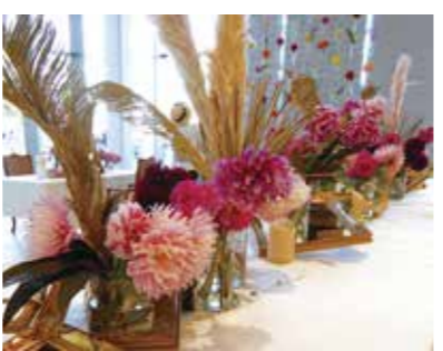
華やかなフォスボットもあります