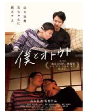
教育委員会社会教育課(☎77・2029 FAX71・1891)

教育委員会と(一社)宝塚市手をつなぐ育成会の共催による、知的障害者への理解を深めるセミナー。 日 時 7月18日(祝)10時~正午 場 所 ソリオホール 先 着 100人 申し込み 7月4日(月)~14日(木)に下記二次元コードまたは電話で教育委員会社会教育課へ。 ※手話通訳・要約筆記あり。 ※一時保育あり(1歳以上の未就学児、先着5人、7月8日(金)までに要予約)。 ©Yuto Takagi