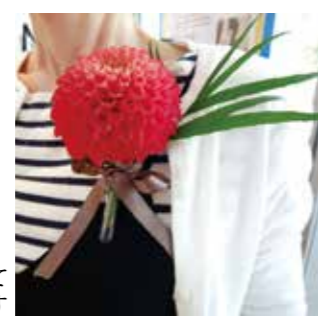
洋服や帽子などに付けて楽しめます

ダリアの生花を使ったコサージュ作りを体験できます。参加者の中から各日先着100人に、手塚治虫記念館の入館料が100円引きになるチケット(イベント参加当日に限り有効)を配布します。 時 間 10時半~16時 (当日随時受け付け) 費 用 500円から