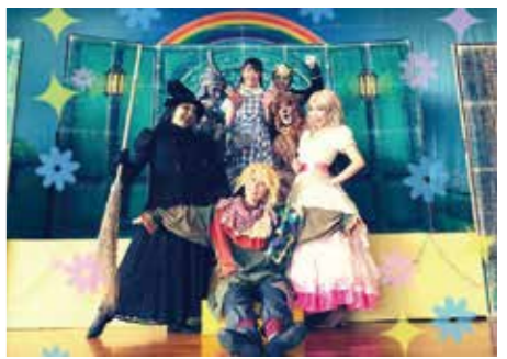
教育委員会学校教育課(☎77・2040 FAX71・1891)

突然の竜巻で虹の向こうのオズの世界へ飛ばされたドロシーが3人の仲間たちと繰り広げる大冒険! スリルと、胸いっぱい感動をお楽しみください。 日 時 8月4日(木)10時半から、14時から 場 所 ソリオホール 抽 選 各回150人 申し込み 往復はがき(126円)に〒住所・代表者の氏名(返信用にも)、電話番号、希望の部(午前・午後)、人数(はがき1枚につき1家族まで)を記入の上、〒665-8665(住所不要)教育委員会学校教育課「子ども人権ミュージカル係」へ。7月19日(火)必着。