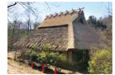
葺き替え前(左側)、葺き替え後(右側)

日時 10月8日(土) 10時、11時半から(各1時間) 場所 宝塚自然の家 定員 各先着15人 申し込み 10月3日(月)～7日(金)に電話で教育委員会社会教育課へ。