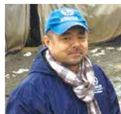
人権男女共同参画課 (☎77・9100 FAX77・2171)