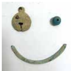
出土遺物の一例(飾金具類)