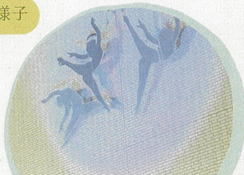
市立 スポーツセンター