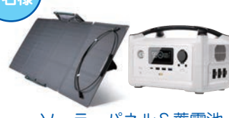
ソーラーパネル&蓄電池 EcoFlow 110W ソーラーチャージャー EcoFlow RIVER Plus 360Wh