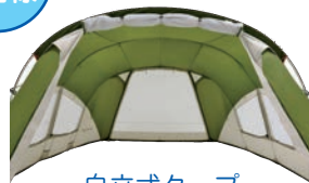
自立式タープ mont-bell ソレイユスクリーン