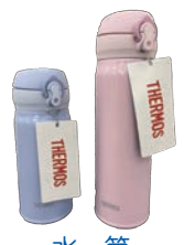
水筒 THERMOS 500&350ml ※カラーは選べません