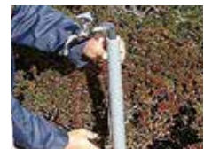
防凍材で保護された水道管