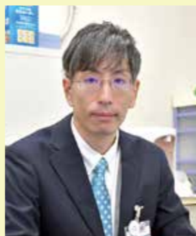
子ども未来部 たからっ子総合相談センター 子ども総合相談課長

◆「あのね」の役割 昨今、社会環境の変化などにより子どもや子育て家庭を取り巻く問題が複雑になっていく中で、保健、福祉、教育の各分野の縦割りや、就学後の子どもの発達に関する相談先の少なさなどが、そうした問題への対応の遅れや十分な支援が行き届いていない現状につながっていると考えています。そこで市は、各分野が組織横断的に連携して支援する仕組みを作るため「あのね」を開設します。