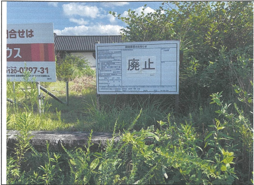
写真-大分類： 工事 細別： 敷地北側の道路側から臨む 写真タイトル： 看板に廃止の表示 撮影箇所： 宝塚市山手台西二丁目3番6 撮影年月日： 2023-07-20