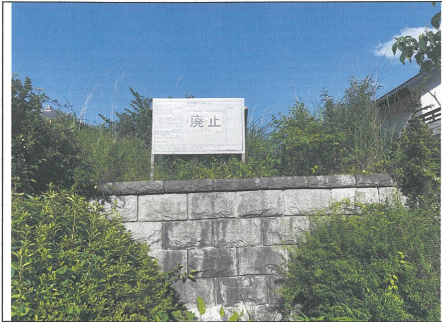
写真-大分類： 工事 細別： 敷地西側の道路側から臨む 写真タイトル： 看板に廃止の表示 撮影箇所： 宝塚市山手台西二丁目3番6 撮影年月日： 2023-07-20