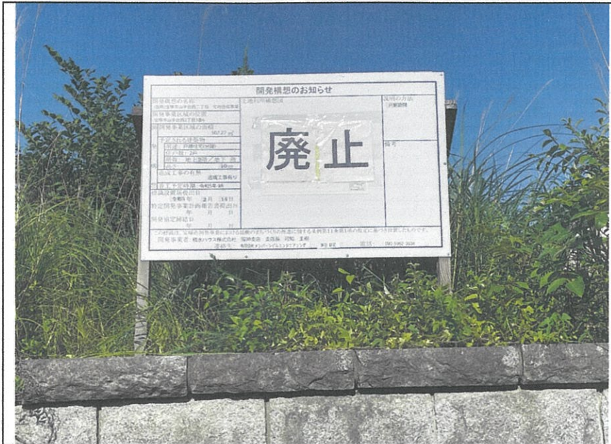
写真-大分類： 工事 細別： 敷地西側の道路側から臨む 写真タイトル： 看板に廃止の表示 撮影箇所： 宝塚市山手台西二丁目3番6 撮影年月日： 2023-07-20