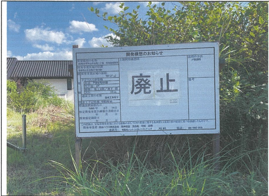
写真-大分類： 工事 細別： 敷地北側の道路側から臨む 写真タイトル： 看板に廃止の表示 撮影箇所： 宝塚市山手台西二丁目3番6 撮影年月日： 2023-07-20