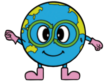
シンボルキャラクター 「あーすちゃん」