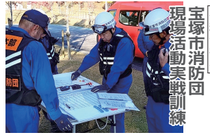
宝塚市消防団 現場活動実戦訓練

令和七年十一月十六日(日)に令和七年度宝塚市消防団現場活動実戦訓練を実施しました。