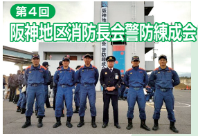
第4回 阪神地区消防長会警防練成会

令和七年十一月二十六日(水)に西宮市消防訓練施設において阪神地区消防長会警防練成会を開催