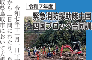
令和7年度 緊急消防援助隊中国・四国ブロック合同訓練

令和七年十一月一日(土)から二日間にわたり、鳥取県鳥取市において大規模災害の発生を想定した緊急消防援助隊中国・四国ブロック合同訓練が実施されました。兵庫県か