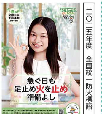
「急ぐ日も 足止め火を止め 準備よし」

3月1日から3月7日までの7日間、全国一斉に「春の全国火災予防運動」が実施されます。 季節が移り変わるこの時期は、空気が非常に乾燥しやすくなり、また強い季節風により、火災が拡大しやすい時期です。このため、市民一人ひとりがより一層防火の重要性を自覚し、日常生活での防火を実践するために、住民、事業所の関係者に強く防火意識の向上を呼び掛けることを目的として火災予防運動を実施します。また、これらの期間中、「住宅防火のいのちを守る 10のポイント」を重点目標の一つとして掲げ、広報物の配布やホームページ、SNSなどのインターネット媒体を活用した火災予防広報を実施します。 さらに、この時期は空気の乾燥や季節風などの気象条件等から山火事が発生しやすい時期となります。山火事はいったん発生すると、消火が容易でないばかりでなく、貴重な森林資源を失うとともに、その森林機能を回復させるのに多大な時間、費用、労力が必要となります。このため、宝塚市では、火災予防週間と同じ期間中に「山火事予防運動」を合わせて実施します。