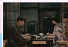
『福田村事件』 ©「福田村事件」プロジェクト2023