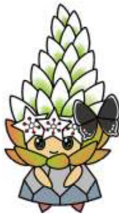
生物多様性マスコットキャラクター ツメレットちゃん