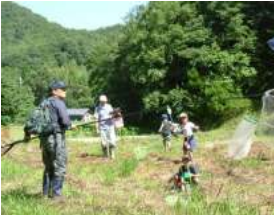
市内での自然観察会の実施状況