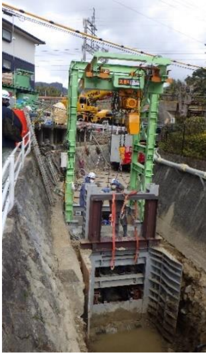
オープンシールド機による施工