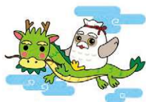
シルバー人材センター マスコットキャラクター チエブクロー