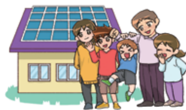
すみれファミリー (宝塚市政マンガ広報キャラクター)