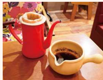
百合珈琲 厚釜焙煎土鍋珈琲

☞ 伊子志3-12-23-102 ☎ 10時～18時 (休) 水曜 ☎ 62・7222