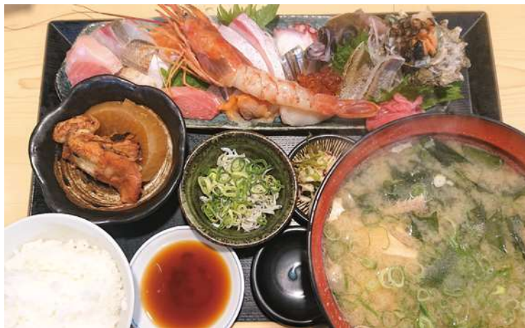
看板メニュー「おつくりデラックス定食」。20種類以上のお造りが味わえる。

本誌9～12月号で行ったアンケート「教えて！あなたのオススメ飲食店」で、市民の皆さんから多くの声が寄せられた飲食店の中から、阪急宝塚南口駅～仁川駅から徒歩5分圏内のお店を「ロコミ」とともに紹介します。