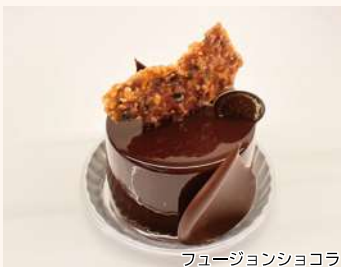
パティスリー ミラヴェイユ 洋菓子

☞ (本店) 泉町19-14 ☎ 9時半～19時 (休) 月曜 ☎ 86・4748