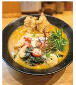
甲殻類で出汁を取った冬のオススメメニュー「鶏天ビスクスープうどん」