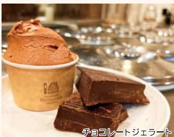
ジェラテリア リントッコ Gelateria Rintocco ジェラート

☞ 逆瀬川2-6-31 ☎ 10時～18時 (休) 日曜、第3月曜 ☎ 72・7511