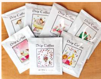
ビーンズ ポット Beans Pot Drip Coffee

☞ 逆瀬川2-6-31 ☎ 10時～18時 (休) 日曜、第3月曜 ☎ 72・7511