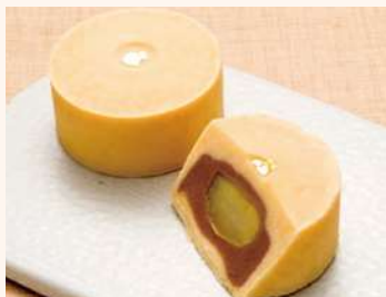
宝菓匠 菅屋 金覆輪

宝塚市には、市内で生産・加工された名産品がたくさんあります。市では、それらを宝塚ブランド「モノ・コト・バ宝塚」として選定し、市内外へ広くアピールすることで、まちの魅力を高め、産業の活性化を目指しています。2・3面掲載のサンドウィッチルマン・たからづか牛乳・アモーレアベラ・パネルの商品も選定品です。そのほか、アンケートで回答があった店舗の選定品をご紹介します。