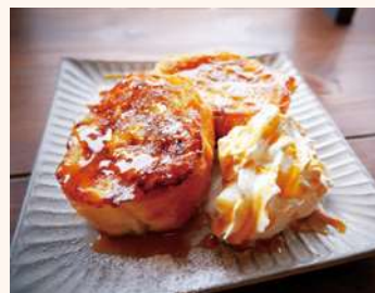
SHIZUKU COFFEE ROASTER フレンチトースト

☞ 伊子志3-15-49 ☎ 11時～19時 (休) 不定休 ☎ 61・8305