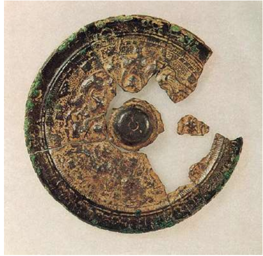
安倉高塚古墳で発掘された神獸鏡