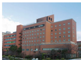
宝塚ワシントンホテル 1泊2食付