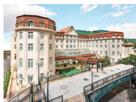
宝塚ホテル 1泊朝食付