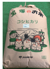
宝塚市産 コシヒカリ 玄米(新米) 30kg