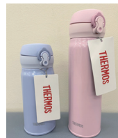
水筒 THERMOS 500&350ml