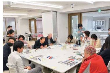
まちづくりワークショップの様子