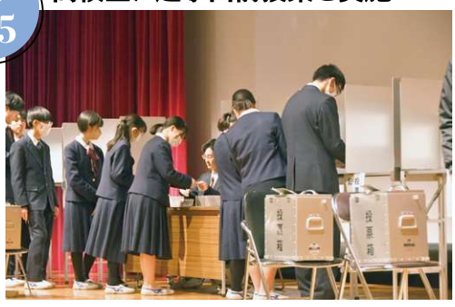
高校生の選挙や政治に対する意識を高めるため、雲雀丘学園高等学校で選挙出前授業を行いました。