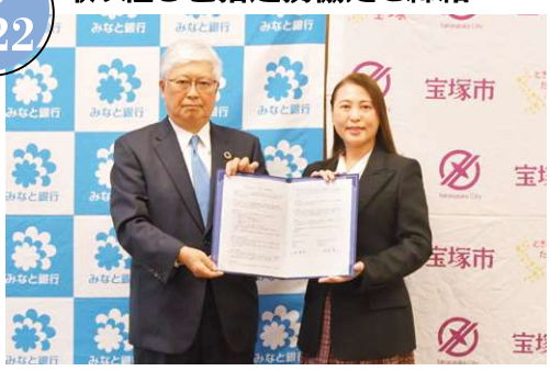
本協定に基づき、宝塚駅から宝塚南口駅周辺エリアにおけるにぎわいづくりに連携して取り組みます。