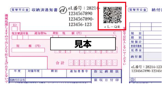
※ QRコードは(株)デンソーウェブの登録商標です。

なお、口座振替については、引き続き実施するため、変更などの手続きは必要ありません。