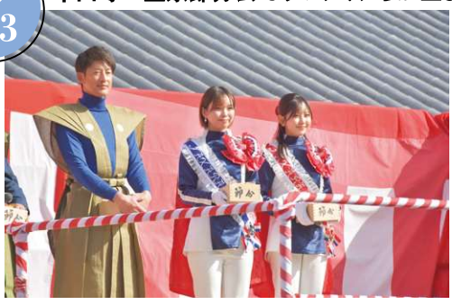
中山寺の星祭節分会が行われ、市長や元プロ野球選手の能見篤史さんらとともに観光大使「サファイア」の2人が豆まきをし、一年の平穏を祈りました。