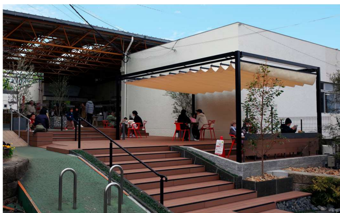
“事始めの拠点”にオープンした「LOG PORT」

※グリーンインフラや都市緑化・コミュニティづくりを手がける東邦レオ(株)が各地で展開する対話型コミュニティプログラム