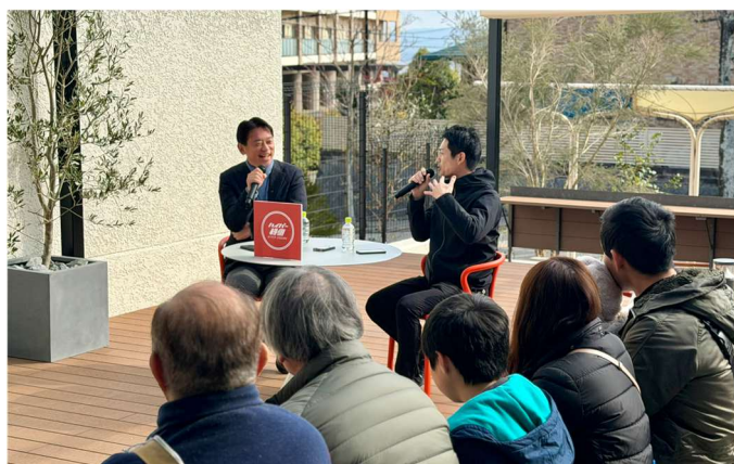
森市長が登壇した「ハイパー縁側」

さらに、2026年4月からは、まちや暮らしに関する学びと発信の拠点として、ファミリーセンター2階の空き店舗の一部に『中山台 APF』の活動スペースを設置します。ここでは、『中山台ニュータウン』の暮らしに関する情報やリサーチ結果、検討状況を地域住民が知り・学び、日常の活動や生活に活かせるよう、さまざまなプログラムを展開していく予定です。