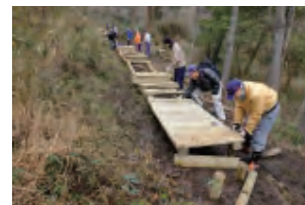
水はけの悪い遊歩道に木道を設置