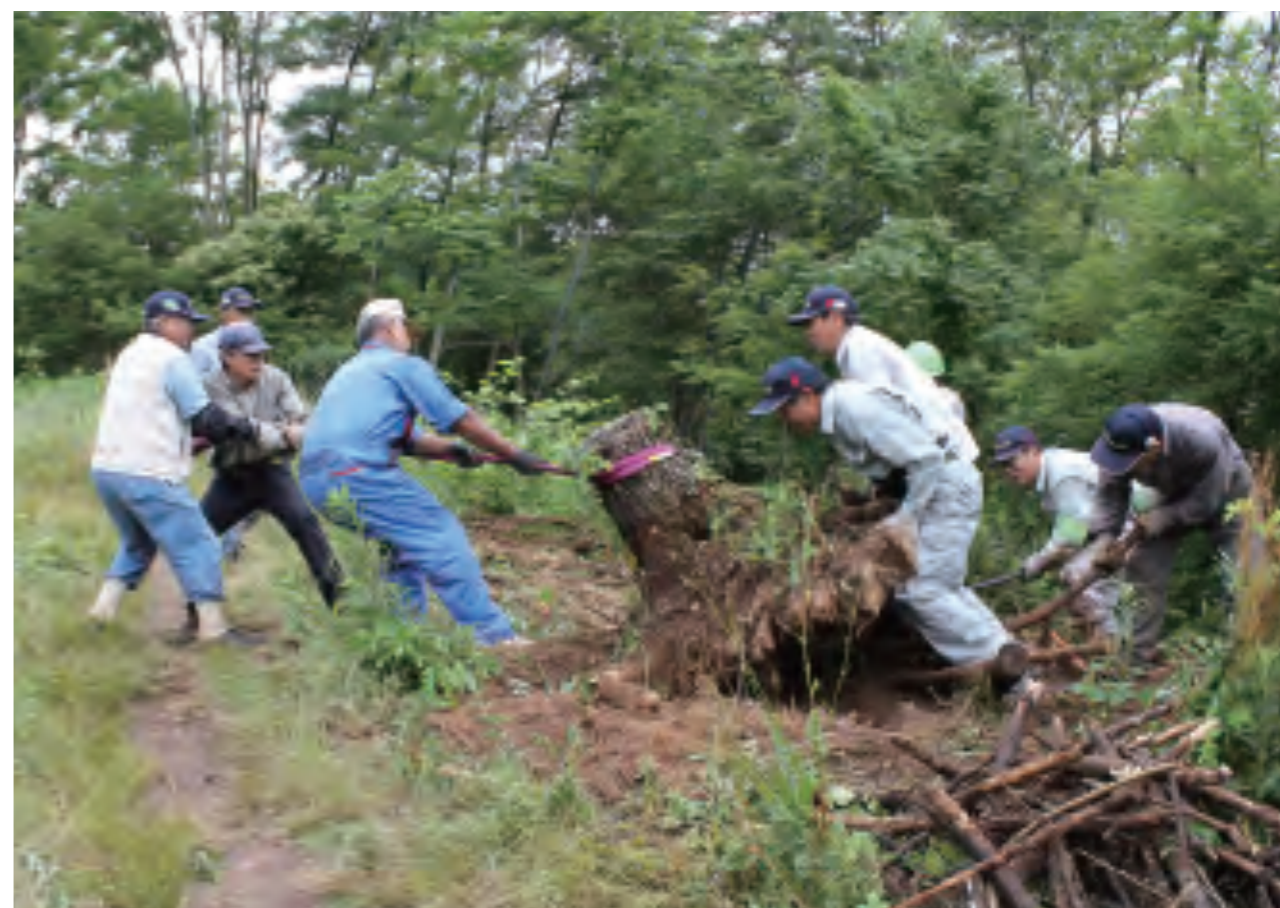
植生を回復させるために外来種であるハリエンジュを駆除