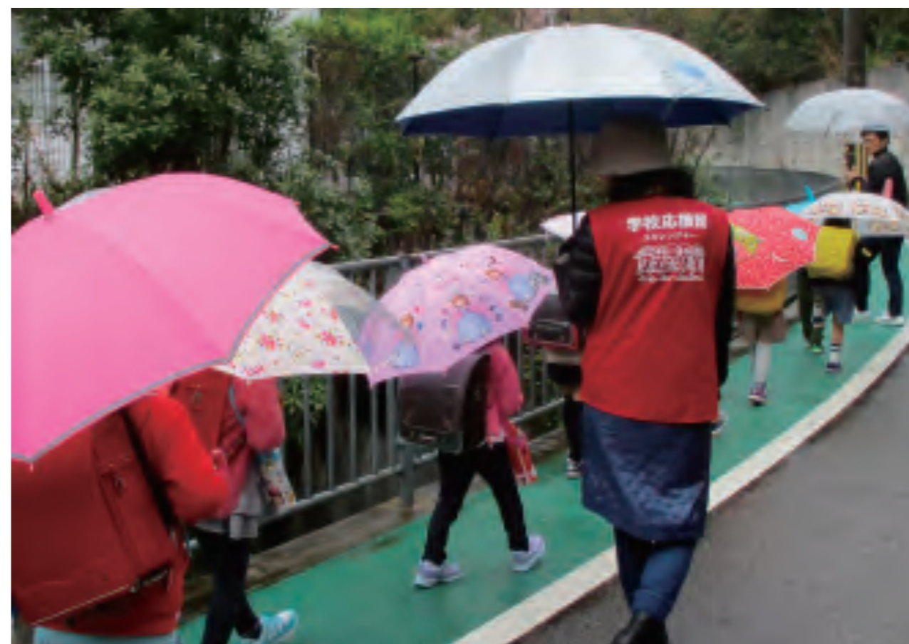
すみれが丘小学校 下校見守り活動

常に学校と丁寧に話し合い、お互いに感謝と尊敬の気持ちを持って接することが、この事業の更なる発展をもたらしてくれるはずである。