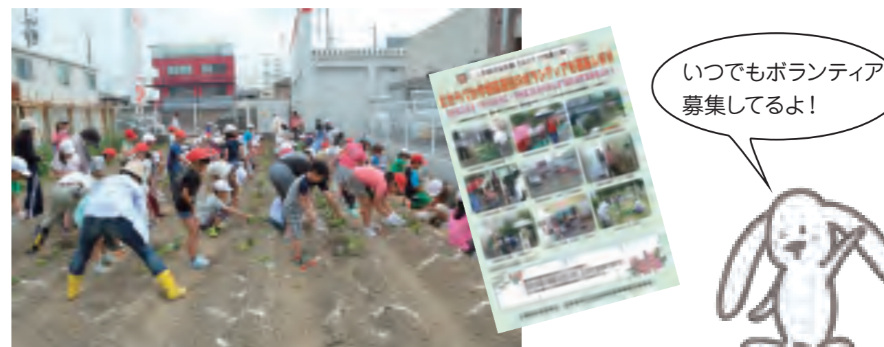
安倉小学校 サツマイモの苗植え作業