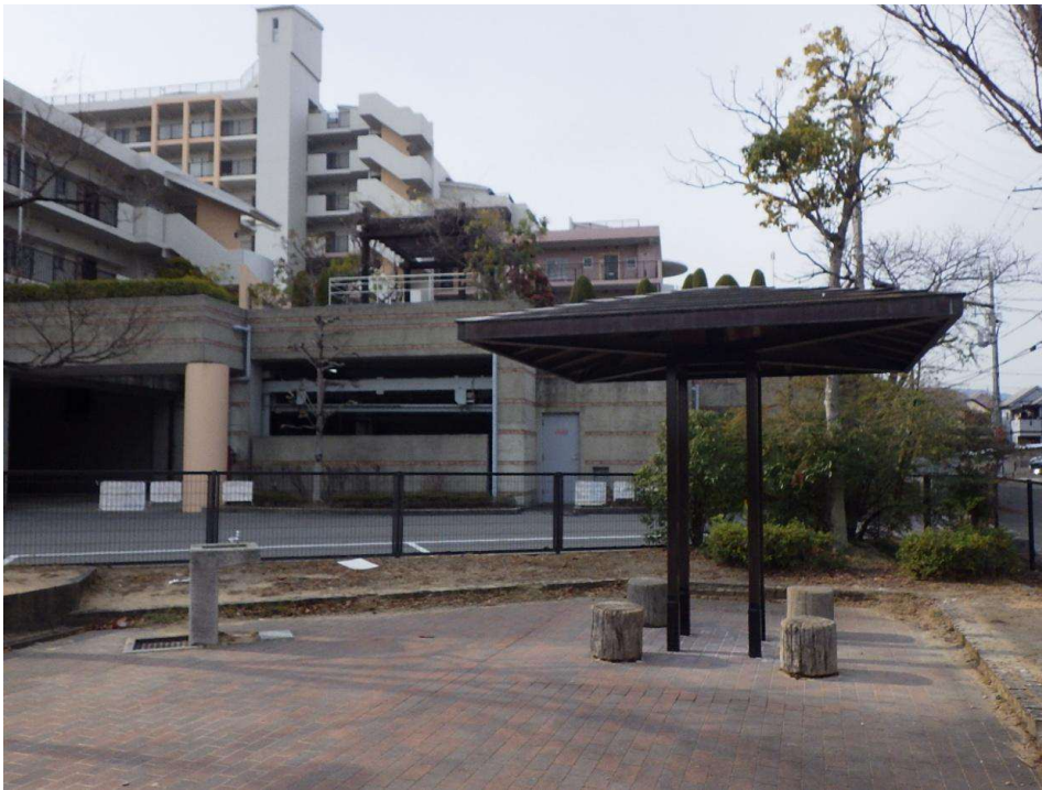
山本丸橋3丁目公園