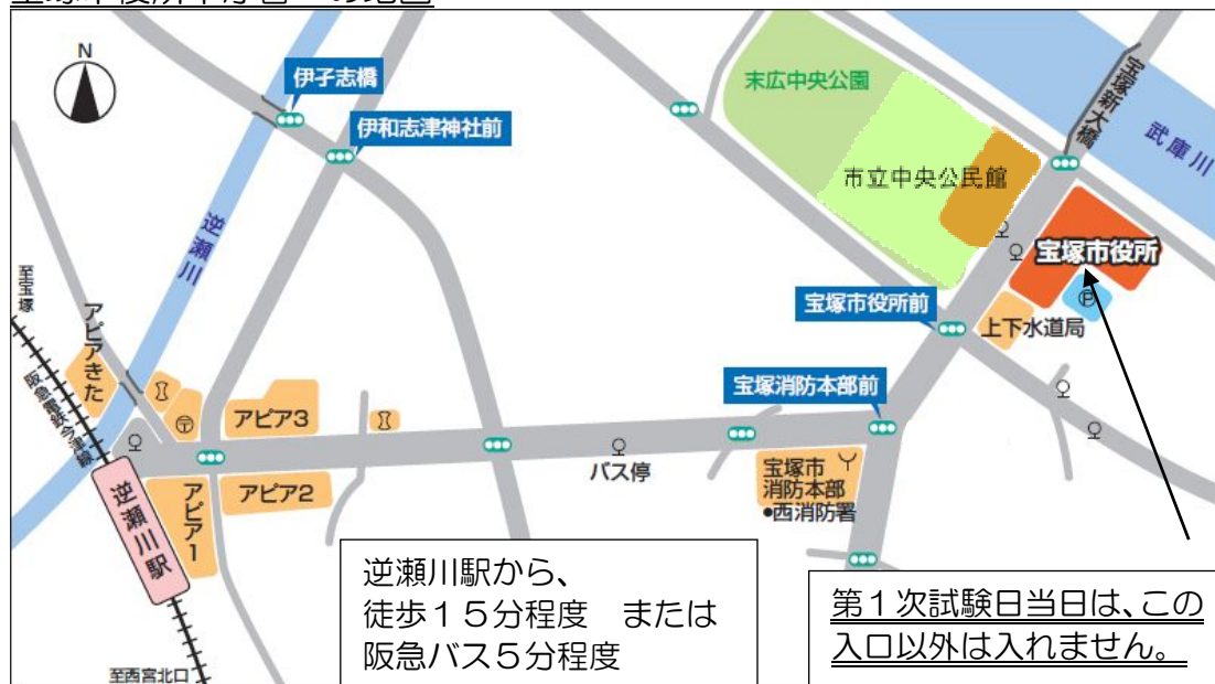
宝塚市役所本庁舎への地図