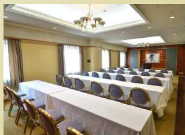
宝塚ワシントンホテル