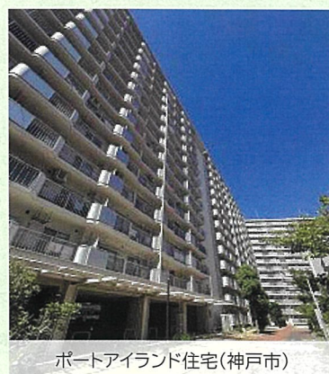
ポートアイランド住宅(神戸市)

※ 耐震改修工事、マンションす・まいる債の積立、 マンション管理計画認定取得により0.6%の金利引下げ(詳細裏面)