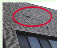
外壁等の剥落 のおそれ