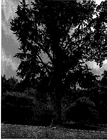
No28 保護樹木(イチヨウ)