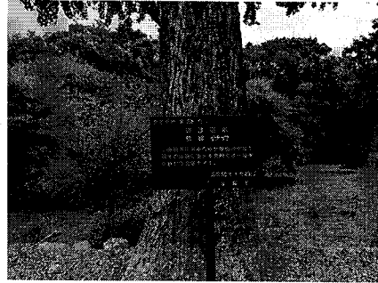
No29 保護樹木(クスノキ)