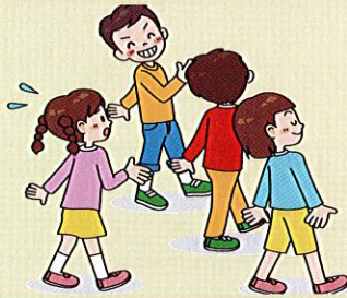
みんなから仲間はずれにされたり無視されたりする