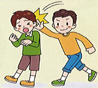
軽くぶつかられたり、たたかれたり、けられたりする