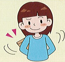
お かね 金やものをとられたり、とられそうになったりする