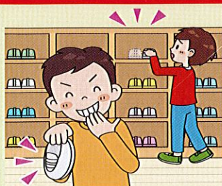
ものをかくされたりこわされたりする