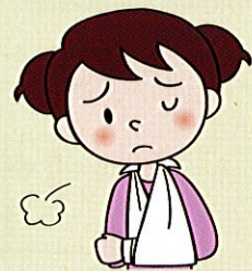
つ よ 強くぶつかられたり、たたかれたり、けられたりする