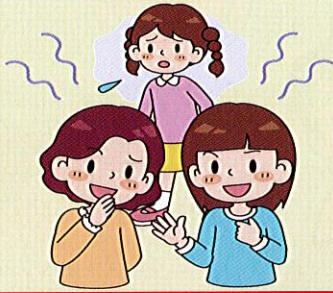
からかわれたり悪口を言われたりする