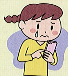
パ こ ンやスマ ほ ホなどを使って、いやなことをされたり書 か き込まれたりする