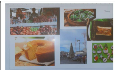
クリスマスマーケットの様子