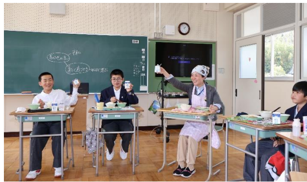
誕生日の生徒をお祝いしました