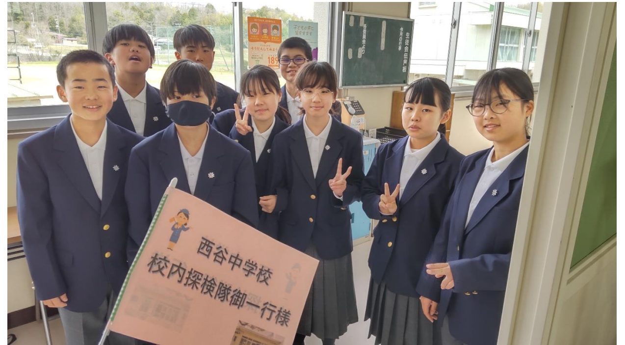
校内探検隊の御一行様

記念に写真を撮影させていただきましたので、ここに紹介します。西谷中にこのような笑顔がたくさん見られるように、教職員が力を合わせていけるように頑張りたいと、改めて思いました。(4月11日(木曜日))