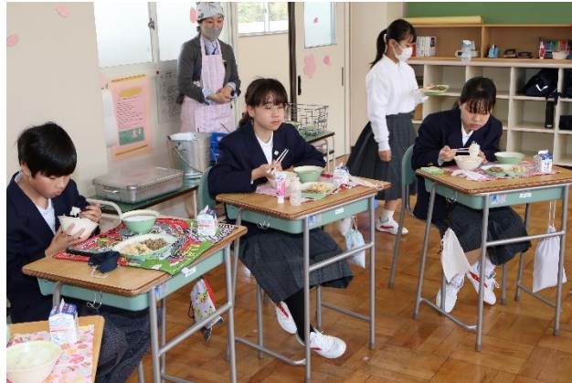
皆で残さずに食べました