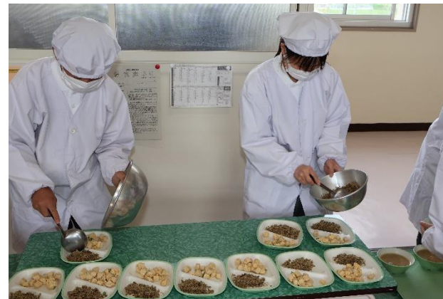
手際よく配膳します

準備ができると、当番の生徒の呼びかけて、手を合わせて「いただきます」と皆で声を揃えていました。