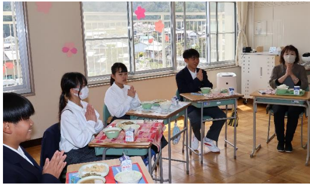
皆揃って「いただきます」