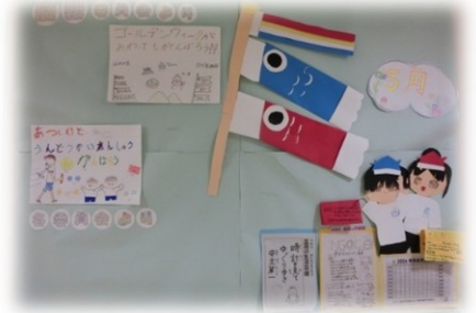
職員室前の『委員会活動掲示板』

全校から意見を募り、運動会のスローガンを決定。現在は手作りで横断幕を作成中です。また、毎週金曜日には学校生活に役立つトピックスを選定し、自分たちの言葉で放送を届けています。全校朝の会では、事前に打ち合わせを行い、司会進行・話を聞いた感想・在校生へのメッセージを話しています。