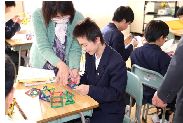
先生からアドバイスをもらいます