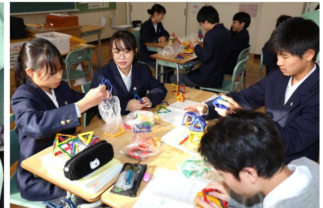
役割分担をしながら取り組む班もあります