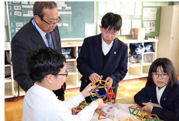
まずは自分たちの力で考えます