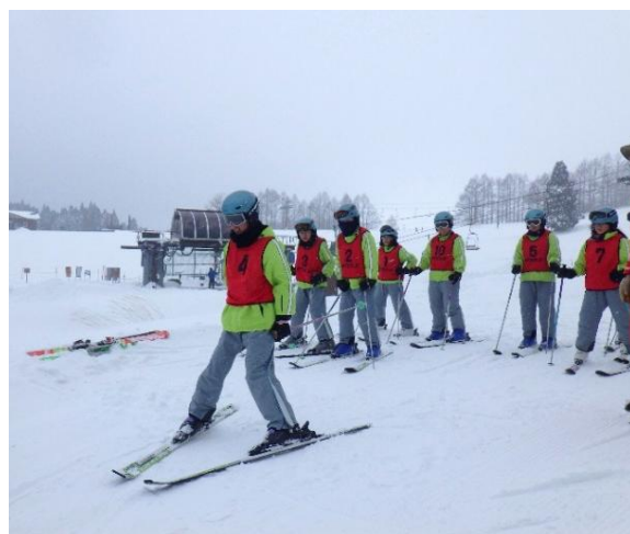
緩斜面を滑ってみます