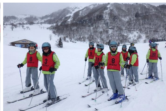
スキー板を履いて実習開始です