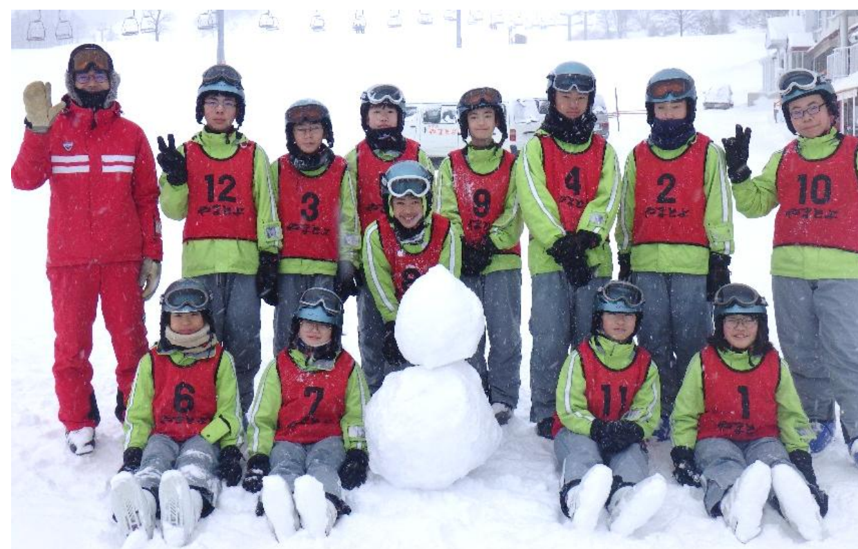
実習後に「雪だるまさん」と記念撮影

１年生が一泊二日でハチ高原へスキー転地学習に行きました。１２名の生徒全員が全ての実習をこなして、最後にはリフトに乗ったり、林間コースを滑ったりすることができるようになりました。スキーは初めての体験という生徒もいましたが、インストラクターの指導で最後まで滑ることができ、挑戦することの大切さを実感できたと思います。１２名の生徒と担任・学年団の先生方の「絆」も深まったことと思います。（１月２７～２８日）