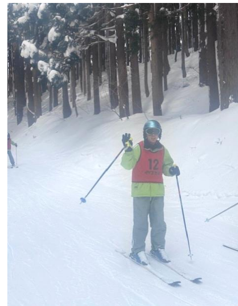
先生、カッコよく撮ってね！！