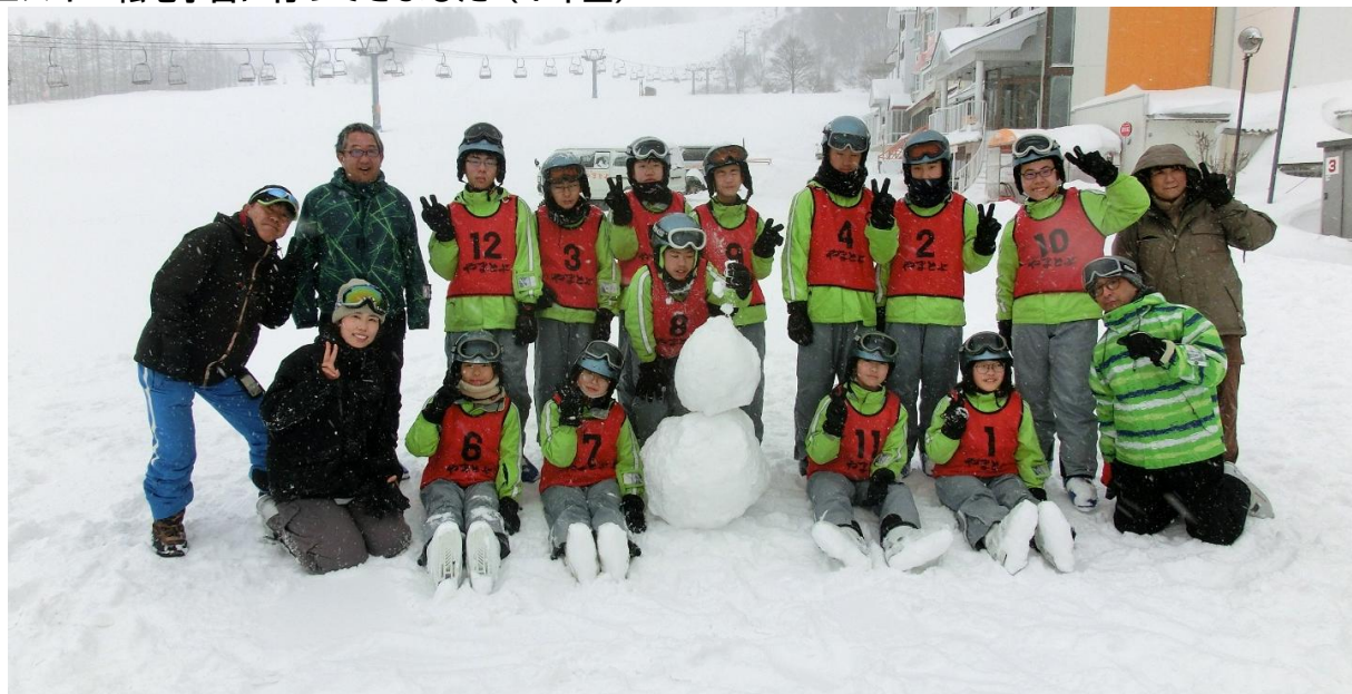
みんなで記念撮影 ハチ高原スキー場（兵庫県養父市）