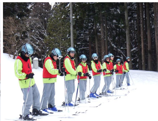
小高い丘から滑ってみます